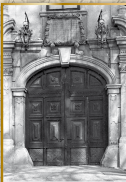
Fotografia z roku 1959 na portál a dvojkrídlovú bránu s kazetovaním, ktorá pochádza pravdepodobne z lordovskej prestavby z 2. polovice 19. storočia. Vstup osvetľovali dve dekoratívne lucerny. (archív PÚ SR, foto Kedro 4/1959)