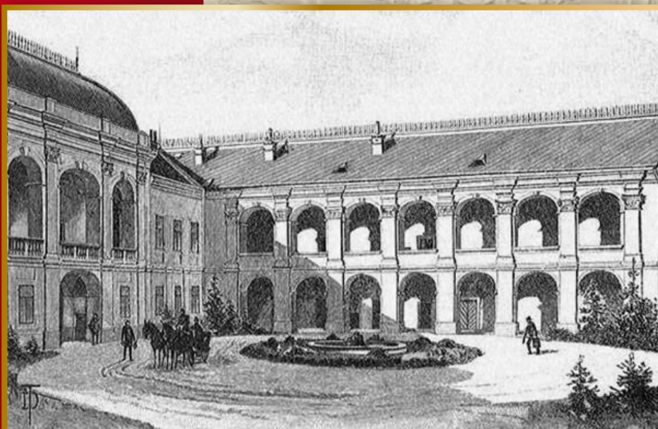
Kresba nádvorja kaštieľa od T. Dörreho po roku 1890. Ústredným motívom nádvorja je kruhová fontána v strede so zdrojom vody. Na prízemí zaujme vstup do kaplnky s pôvodnými dvojkrídlovými dverami. (zdroj Osztrák-Magyar Monarchia irásban és képen, V., s. 165)